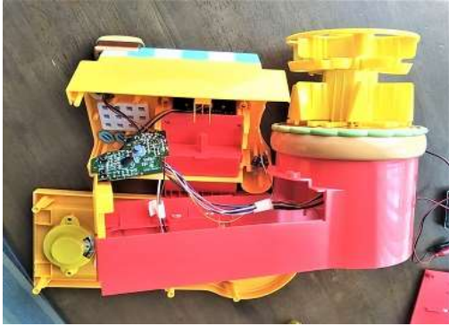
本体カバーを外したところ