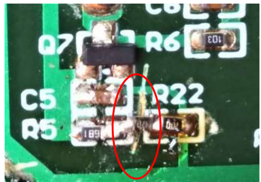
R5とR22の間のパターンを削り取った痕がある、その間に抵抗器を後付けしてあるが、意味は不明