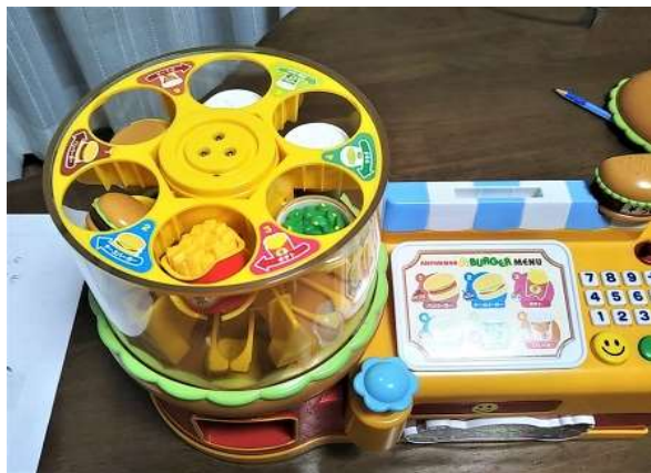
回転体中央部の3本の止めビスの内、1本が外れて中に落下していた。