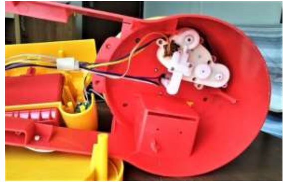
回転体裏側のギアボックス