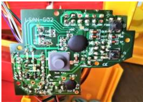
基板の裏側 あちこちで修理(?)の形跡あり