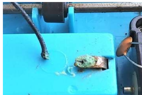
マイナス側電池端子の青錆、線の外れ