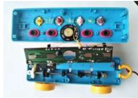
基板内部とスイッチ裏側

4種類のボタンを押すと、音楽が鳴り、動物が動く、 モーターでカムギアを回して、動物を動かしている。