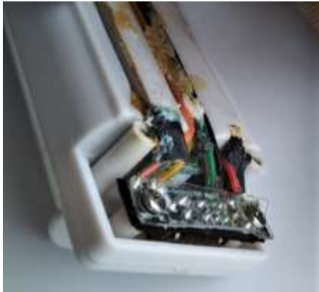
スイッチ基板 (汚れ除去後)