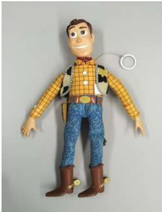
ウッディ人形 右上のリングがプルスイッチ